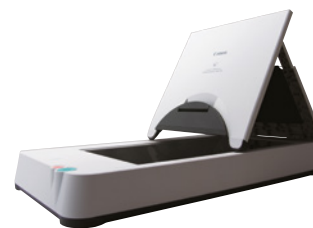
Scanner piano Flatbed A4 101